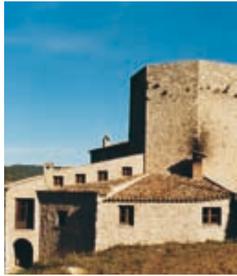
Tour polygonale avec les constructions adossées

Dès que vous avez descendu le chemin du château de Claramunt et que vous arrivez à la route, tournez à droite. Quelques mètres plus loin, prenez la BV-2131. Au km 7, vous devez tourner à gauche par la BV-2132. Situé au sommet d’un rocher sur la rive droite de la rivière Carme, il permettait un bon contrôle de la vallée. Depuis le XIIIe siècle, il est principalement rattaché à la maison Cardona. En 1320, à cause des litiges entre Ramon Folc de Cardona et l’Infant Alfons, celui-ci l’a fait démolir. À mesure que vous vous approchez, vous voyez comment le château primitif a été englouti par les constructions modernes. Le seul vestige conservé est une magnifique tour à six côtés avec deux des arêtes arrondies. Vous pouvez vous rapprocher en franchissant un portail jusqu’à toucher la roche sur laquelle se dresse la tour. La construction, qui pourrait dater du XIVe siècle, a été restaurée en 2004. La hauteur actuelle est de 12 m. Les murs sont réalisés en blocs de pierre petits et moyens, plus travaillés dans quelques zones que d’autres. La visite du château est extérieure et libre. À Orpí, il est également intéressant de visiter l’église romane de Sant Miquel, juste à côté du château, et l’église gothique de Santa Càndia, au fond de la vallée.