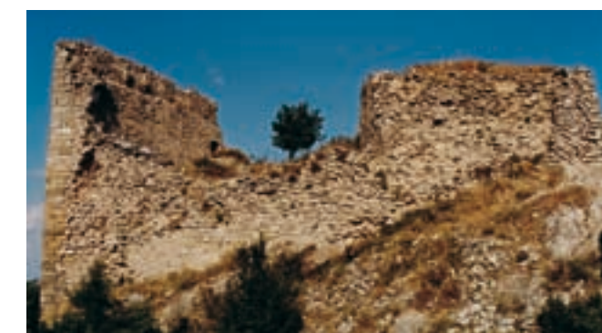
Ruines du château

Revenez au rond-point de la C-37 en faisant le trajet précédent en sens inverse. Prendre ensuite la route B-220, direction Santa Coloma de Queralt et Bellprat. Environ 100 m après le panneau du km 8, vous devrez prendre à droite. Quand vous aurez parcouru 2,9 km de piste, vous arriverez à l’église romane de Sant Jaume, aux pieds du château. Nous vous recommandons de commencer l’itinéraire par cette église qui est entièrement restaurée. Ensuite, un sentier pentu vous mènera au château, au-dessus d’une formation rocheuse. Il faut redoubler de précautions pendant les mètres finaux et en particulier dans la forteresse. La domination du château était initialement entre les mains des comtes de Barcelone qui, en 976, l’ont vendu au vicomte Guitard. Ensuite, il a fait partie de la baronnie de Queralt. Il est situé à 851 m de hauteur, à l’un des points les plus élevés de la chaîne de Miralles-Queralt. Ses vues spectaculaires permettent de distinguer de nombreuses fortifications parmi lesquelles celle de Vilademàger. Queralt est un exemple de l’importance que possédait l’intercommunication en cas de danger. L’édifice du château, qui au début du XXe siècle conservait