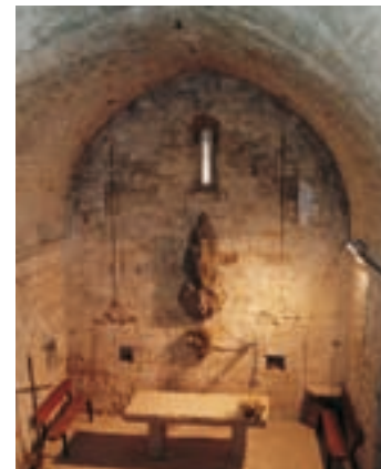
Église de Santa Maria

constructions militaires de l’ensemble. Bien qu’elle soit presque rectangulaire avec des angles arrondis. Étant donné ses dimensions, il faut supposer qu’elle avait une fonction résidentielle. Sur les murs, construits avec des blocs de pierre à peine dégrossis, vous verrez diverses rangées d’opus spicatum. La porte originale d’accès se trouve à la hauteur du premier étage, un fait habituel au Haut Moyen Âge. Il semble cohérent de dater l’édifice du Xe siècle. Le rez-de-chaussée accueille plusieurs expositions dans deux salles.