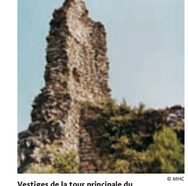
Vestiges de la tour principale du château de Vilademàger

“La légende raconte que le seigneur d’Òdena souhaitait se marier avec la fille du seigneur de Jorba, très admirée par son extraordinaire beauté. Celui-ci ne le voulait pas comme gendre car il pensait qu’il était un noble aux coutumes barbares et de catégorie inférieure. L’amoureux, le cœur brisé, pour prouver son amour, a ordonné à ses vassaux de paver de dalles en or massif le chemin qui reliait les deux châteaux. Ainsi il pourrait courtiser la donzelle sans que celle-ci marche dans la poussière de la terre. Le seigneur de Jorba, impressionné par le leçon que lui avait donné le prétendant, n’a pas hésité à lui donner la main de sa fille.”