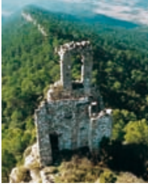
Vestiges de l’église de Sant Miquel

Revenez au rond-point de la C-37 en faisant le trajet précédent en sens inverse. Prendre ensuite la route B-220, direction Santa Coloma de Queralt et Bellprat. Environ 100 m après le panneau du km 8, vous devrez prendre à droite. Quand vous aurez parcouru 2,9 km de piste, vous arriverez à l’église romane de Sant Jaume, aux pieds du château. Nous vous recommandons de commencer l’itinéraire par cette église qui est entièrement restaurée. Ensuite, un sentier pentu vous mènera au château, au-dessus d’une formation rocheuse. Il faut redoubler de précautions pendant les mètres finaux et en particulier dans la forteresse. La domination du château était initialement entre les mains des comtes de Barcelone qui, en 976, l’ont vendu au vicomte Guitard. Ensuite, il a fait partie de la baronnie de Queralt. Il est situé à 851 m de hauteur, à l’un des points les plus élevés de la chaîne de Miralles-Queralt. Ses vues spectaculaires permettent de distinguer de nombreuses fortifications parmi lesquelles celle de Vilademàger. Queralt est un exemple de l’importance que possédait l’intercommunication en cas de danger. L’édifice du château, qui au début du XXe siècle conservait