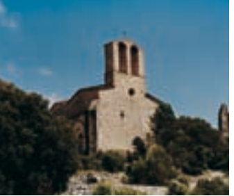
Église de Sant Pere du château de Vilademàger

Après avoir visité le château de Miralles, si vous avez le temps, vous pouvez vous aller à celui de Vilademàger, dans la commune de la Llacuna et à celui de Queralt, à Bellprat, qui se trouvent relativement près. Vous devez descendre à la C-37, tourner à droite et, plus loin, au rond-point, prendre la sortie de la Llacuna. Quand vous arrivez au village, prenez la direction Sant Joan de Mediona (indiquée). Juste avant d’arriver au panneau signalant la fin du village, prenez à droite en suivant le panneau du camping. Continuez par une piste jusqu’à arriver, après le cimetière, à une petite esplanade avec un chemin de traverse. Nous vous conseillons de faire à pied le chemin depuis ce point jusqu’au château.