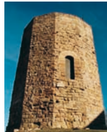
Tour de château avec la porte d’origine

être divisée en quatre niveaux dont l’intérieur fait actuellement fonction de réservoir. À environ 3,60 mètres s’ouvre la porte d’accès. À proximité de la tour, vous observerez les vestiges de la muraille du périmètre. Si vous vous promenez dans la rue d’en dessous, vous pourrez mieux les voir. La visite du château est extérieure et libre, et il est possible de la compléter par la visite de l’église de Sant Miquel, de style roman, située à quelques centaines de mètres. De plus, la toute proche ville d’Igualada, capitale du canton, vous offre un vaste éventail de possibilités. Pour finir, nous vous résumons une des légendes les plus belles de notre pays.