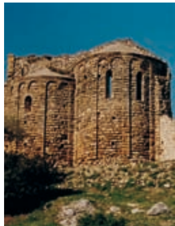
Abside de l’église de Santa Maria

Le chemin de guet montre clairement qu’il s’agissait d’une muraille d’à peine quelques mètres de hauteur. L’église de Santa Maria, de typologie romane, et la chapelle de Santa Margarida, d’époque gothique, complètent le reste de l’ensemble tout en renforçant le secteur où se trouve l’entrée de la forteresse. Le château de Claramunt est un exemple réussi de comment un même espace architectural regroupe souvent des constructions et des éléments stylistiques d’époques très différentes.