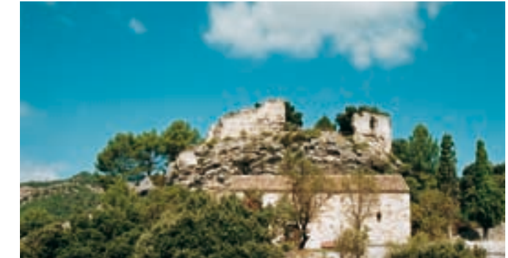
Château de Miralles © MHC

constructions militaires de l’ensemble. Bien qu’elle soit presque rectangulaire avec des angles arrondis. Étant donné ses dimensions, il faut supposer qu’elle avait une fonction résidentielle. Sur les murs, construits avec des blocs de pierre à peine dégrossis, vous verrez diverses rangées d’opus spicatum. La porte originale d’accès se trouve à la hauteur du premier étage, un fait habituel au Haut Moyen Âge. Il semble cohérent de dater l’édifice du Xe siècle. Le rez-de-chaussée accueille plusieurs expositions dans deux salles.