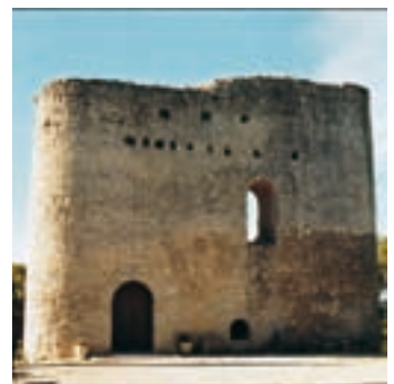
Tour maîtresse

Pour arriver à La Tossa, il faut retourner à la C-37 et tourner à gauche, direction Igualada. Au km 60 se trouve le chemin de traverse qui mène à la forteresse. Le château appartient, entre autres seigneurs, au Comte Borrell II, au roi Jaume II et aux Cardona. Actuellement, il appartient à la fondation La Tossa. En 2004 un consortium a été créé entre la Mairie de Santa Margarida de Montbui et la fondation afin de compléter la récupération et l’op-