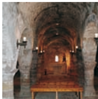
Église de Santa Maria. Sur l’autel se trouve une réplique de la disparue Vierge de Gràcia

timisation du monument et de son environnement. Il est possible de commencer la visite de l’église par l’église romane de Santa Maria, qui a été la paroisse de la commune jusqu’en 1614. Elle comprend trois nefs fermées à l’est par deux absides couvertes de voûtes en cul-de-four et décorées d’arcatures lombardes entre les absides à l’extérieur. Si vous dirigez vers l’intérieur, vous observerez de magnifiques arcades soutenues par des colonnes, sauf dans la partie la plus occidentale où les arcades reposent sur des piliers quadrangulaires. Sans doute cette partie où les voûtes adoptent légèrement la forme d’un fer à cheval est préromane, de la fin du Xe siècle. Le clocher et la chapelle ouverte dans le mur nord correspondent à des réhabilitations ultérieures. Sur l’autel est vénérée une réplique de la disparue Vierge de Gràcia.