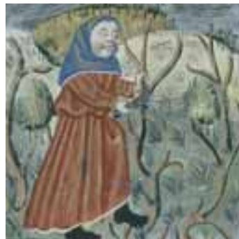
Taille de la vigne.

Ces derniers se trouvent du côté est de l'ensemble monastique, étant la partie la plus humide et protégée des vents forts en provenance du nord. Les jardins potagers étaient directement reliés à la cuisine médiévale du monastère, située sous les porches de la face nord, ainsi qu'avec la zone des étables, ateliers et entrepôts qui se trouvaient dans le secteur des porches à l'ouest. Le jardin potager du monastère médiéval apportait les aliments végétaux de la cuisine de l'époque : des choux, oignons, melons, courges, petits pois, fèves des marais, mais également des plantes médicinales que les moines utilisaient pour l'élaboration de remèdes contre différentes maladies, telles que la sauge, la rutacée, le romarin et la menthe, entre autres.