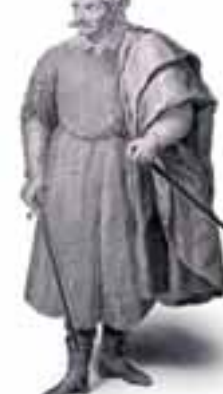
Portrait du pirate Barberousse. Museu Marítim de Barcelona

qu'en raison des attaques continues des pirates, ses habitants décidèrent de partir vers un endroit plus sûr, peut-être à l'intérieur des murs du monastère ou quelque part à l'intérieur de ses domaines.