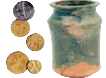
Trésor monétaire de Sant Pere de Rodés.

Le palais de l'Abbé est un édifice gothique composé de trois étages qui s'élève sur les restes de constructions et de tombes de la première époque du cénobitisme. Il est estimé que ses origines datent entre les X e et XII e siècles, et actuellement il ne reste plus que la façade extérieure. Il est également possible d'observer deux fenêtres géminées et des créneaux au-dessus de la façade.