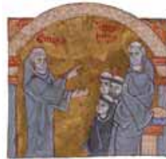
Moines bénédictins

ITINÉRAIRES AUTOUR DU MONASTÈRE DE SANT PERE DE RODES L'ENSEMBLE MONUMENTAL SITUÉ DANS LA CHAÎNE DE MONTAGNES DE RODES, COURONNÉ PAR LE MONASTÈRE DE SANT PERE, EST COMPOSÉ D'UNE SÉRIE DE MONUMENTS ET STRUCTURES RELEVANT D'UN GRAND INTÉRÊT HISTORIQUE QUI PERMETTENT DE COMPRENDRE LE FONCTIONNEMENT DE L'IMPORTANT CENTRE DE POUVOIR FÉODAL QUE CONSTITUA L'ABBAYE, AINSI QUE L'ÉVOLUTION DU PAYSAGE DE SES ALENTOURS. PERMETTEZ-NOUS DE VOUS RECOMMANDER LES POINTS D'INTÉRÊT TOURISTIQUE QUI COMPLÉTERONT VOTRE VISITE AU MONASTÈRE DE SANT PERE DE RODES.