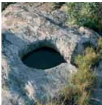
Trou dans la roche situé sur la colline du coll del Bosc. MHC

Un petit chemin partant de l'esplanade du coll del Bosc arrive jusqu'à la ville de la Selva de Mar. La durée du trajet est d'une heure pour la descente et une heure et demie pour la montée.