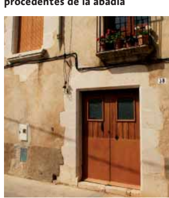
Calle de Santa Maria

Paseando por el pueblo, podemos identificar algunos elementos arquitectónicos procedentes de la abadía integrados en casas particulares. De todas formas, el Ayuntamiento de Vilabertran, mediante el Plan de Protección y Dinamización del Patrimonio Cultural de 2006, ha catalogado todos estos elementos como Bienes Culturales de Interés Local, de forma que gozan de protección parcial.