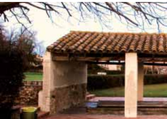
Fuente del Abat Rigau y lavadero

La Torre D'en Reig, con elementos que emulan la naturaleza y con reminiscencias de fortificación medieval, tiene muchas similitudes con la casa forestal de Sant Martí d'Empúries. Consta de planta baja, dos pisos, desván y una torre. Los muebles fueron diseñados especialmente para el edificio siguiendo el estilo modernista.