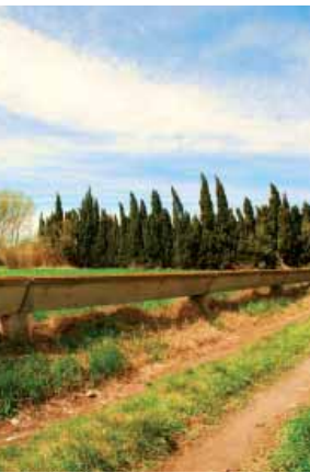
Paisaje de huerta

Desde el lavadero, y enfilando en dirección oeste por un caminito que bordea los campos de cultivo y las canalizaciones de riego, comprobamos que el pueblo de Vilabertran es un paraje típico del llano ampurdanés, con las cercas hechas de cipreses dispuestos de este a oeste para evitar que la tramontana se lleve la tierra de los campos de cultivo. Un lugar rico en agua y muy fértil, resultado de las desecaciones de marismas que se hicieron a partir del siglo XIV, donde tradicionalmente se ha desarrollado la agricultura de huerta. Todavía hoy, si paseamos por los alrededores del pueblo podemos ver, dependiendo de la época del año, los huertos, tan característicos de la villa. En Vilabertran no encontramos grandes distribuidoras, sino que se trata de un cultivo de carácter familiar, en el que la variedad de las hortalizas que se producen es la principal característica. Estas hortalizas se destinarán a la venta directa al consumidor en los mercados de verdura de los pueblos