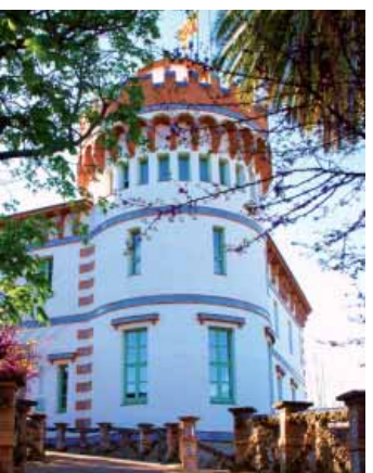
Torre d'en Reig

Si continuamos por la calle de los Comuners de Castella llegamos a la Torre D'en Reig, un edificio de finales del siglo XIX y principios del XX, de estilo modernista, construido por encargo de Josep Reig i Palau, hijo de Vilabertran e ingeniero forestal encargado de fijar las dunas de Empúries. Para tener una visión más completa del edificio, podemos acceder a los jardines por la entrada principal y salir por el acceso lateral.