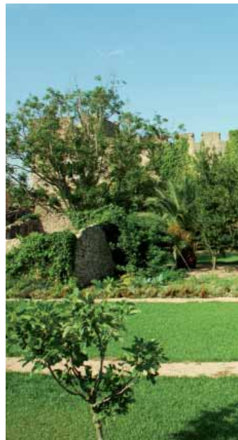
Huerto del Prior

Al este de la abadía se extiende la zona que era destinada a los huertos. Uno de los rasgos más característicos de los monasterios era la autonomía, tanto organizativa como económica. En la zona de los huertos se cultivaban los alimentos que aseguraban su sustento, como coles, pepinos, acelgas, calabazas, guisantes o zanahorias, así como hierbas medicinales para la elaboración de remedios, como la salvia y el romero.