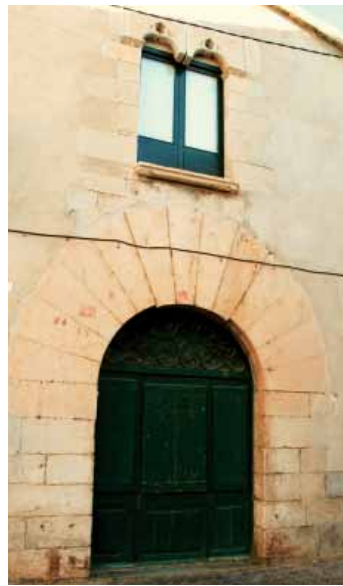
Plaza del Doctor Heras

Heras, donde podemos contemplar otro portal adovelado y una ventana geminada con arquillos de forma trilobulada y decoración floral, como las ventanas de la fachada sur del palacio abacial. Finalmente, si enfilamos a la derecha la calle Empordà y giramos a la izquierda, en la calle de los Comuners de Castella, encontramos una casa con un portal de sillares y una ventana con las mismas características que la anterior.