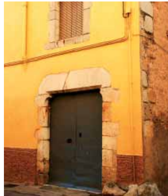
Calle dels Comuners de Castella

Heras, donde podemos contemplar otro portal adovelado y una ventana geminada con arquillos de forma trilobulada y decoración floral, como las ventanas de la fachada sur del palacio abacial. Finalmente, si enfilamos a la derecha la calle Empordà y giramos a la izquierda, en la calle de los Comuners de Castella, encontramos una casa con un portal de sillares y una ventana con las mismas características que la anterior.