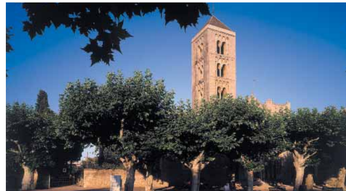
Exterior de la iglesia

La fachada de la iglesia de Santa María de Vilabertran es del siglo XII. Vemos claramente un cambio en el trabajo de la piedra. Las ventanas son de doble derrame, con arco de medio punto y decoradas con un friso de dientes de sierra en la parte superior. La portalada original fue derruida para construir otra, de estilo gótico. Del románico nos ha llegado el tímpano liso, y del gótico, que no llegó a concluirse, nos han llegado los montantes de las arquivoltas y el dintel.