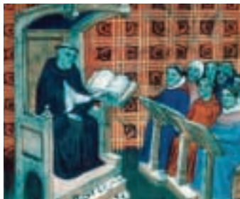
Escena en un convent benedictí a mitjans de segle XIV.

ITINERARIS AL VOLTANT DEL MONESTIR DE SANT PERE DE RODES EL CONJUNT MONUMENTAL DE LA SERRA DE RODES, ENCAPÇALAT PEL MONESTIR DE SANT PERE, ES COMPLEMENTA AMB UNA SÈRIE DE MONUMENTS I D'ESTRUCTURES DE GRAN INTERÈS HISTÒRIC QUE ENS PODEN AJUDAR A COMPRENDRE EL FUNCIONAMENT DEL GRAN CENTRE DE PODER FEUDAL QUE VA SER L'ABADIA, I L'EVOUCIÓ PAISATGÍSTICA DEL SEU ENTORN. DES D'AQUÍ, US VOLEM RECOMANAR ELS PUNTS D'INTERÈS QUE PODEN COMPLETAR LA VISITA AL MONESTIR DE SANT PERE DE RODES.